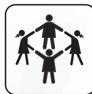
Capacité 2 enfants